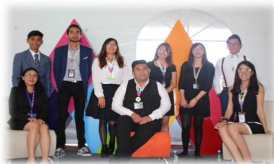
Figura 5. Estudiantes de la UPCI