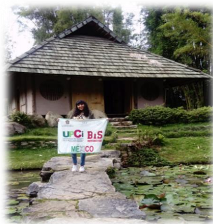
Figura 9. Estudiante en movilidad internacional