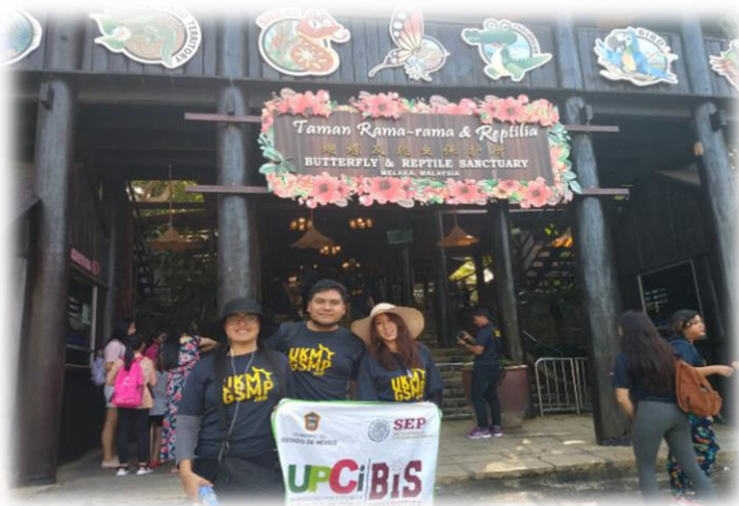
Figura 8. Estudiantes en Malasia