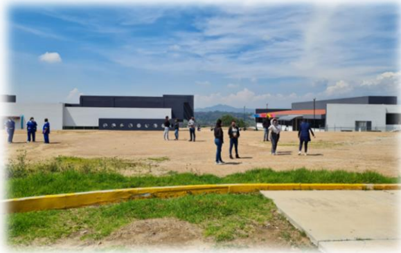
Figura 10. Patio trasero