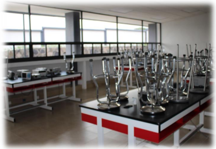
Figura 7. Laboratorio de química