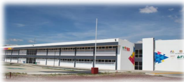
Figura 1. Edificio principal