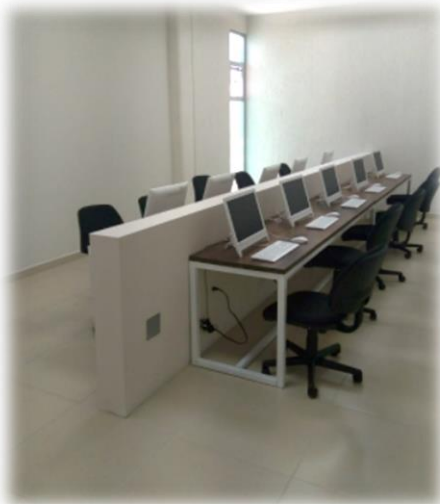
Figura 6. Laboratorio de cómputo