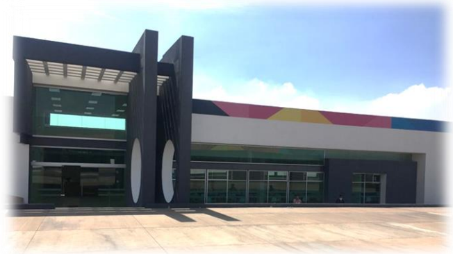
Figura 11. Edificio de Laboratorios Pesados