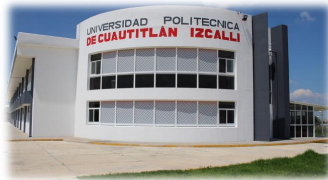
Figura 4. Vista trasera del edificio principal

Igualdad: Avalar el acceso a la educación y crecimiento profesional por igual para la comunidad universitaria.