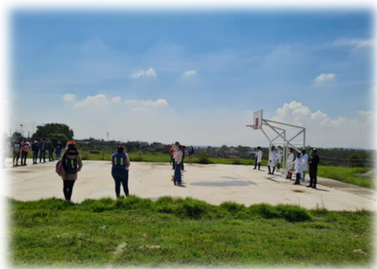
Figura 2. Canchas deportivas

Las Políticas Educativas se enfocan en ampliar de manera sostenida las oportunidades de acceso a la educación para que esta sea de calidad y pertinente; preocupándose por atender la absorción, cobertura, reprobación, equidad e igualdad; por lo cual la Universidad Politécnica de Cuautitlán Izcalli, comparte la responsabilidad con estas políticas en la formación profesional de sus estudiantes.