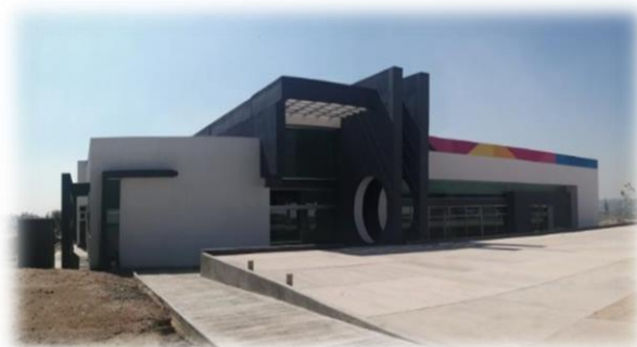
Figura 3. Centro de Información y Documentación